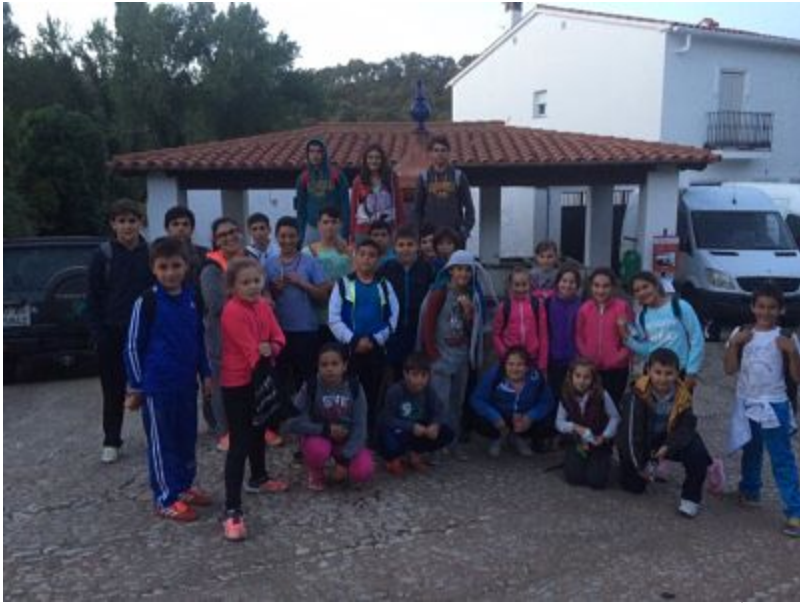
( http://www.ayto-elalmdro.es/export/sites/elalmdro/es/.galleries/imagenes-noticias/noticias-2016/senderismo_opt.jpg )